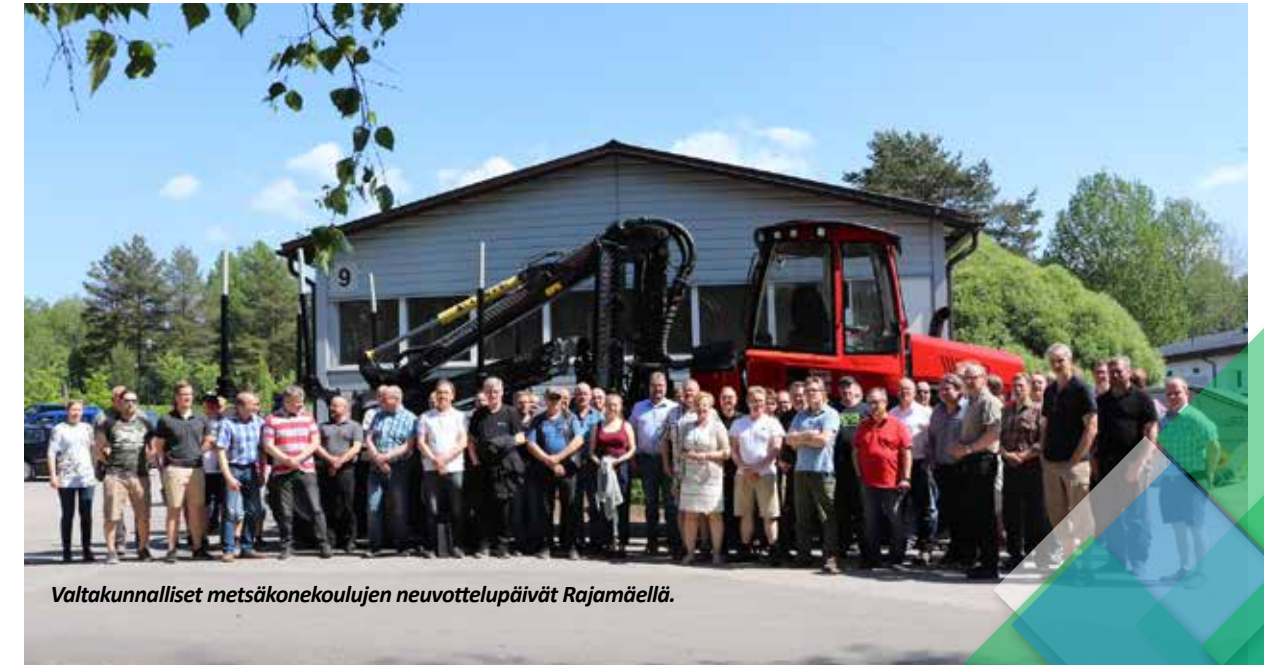
Valtakunnalliset metsäkonekoulujen neuvottelupäivät Rajamäellä.