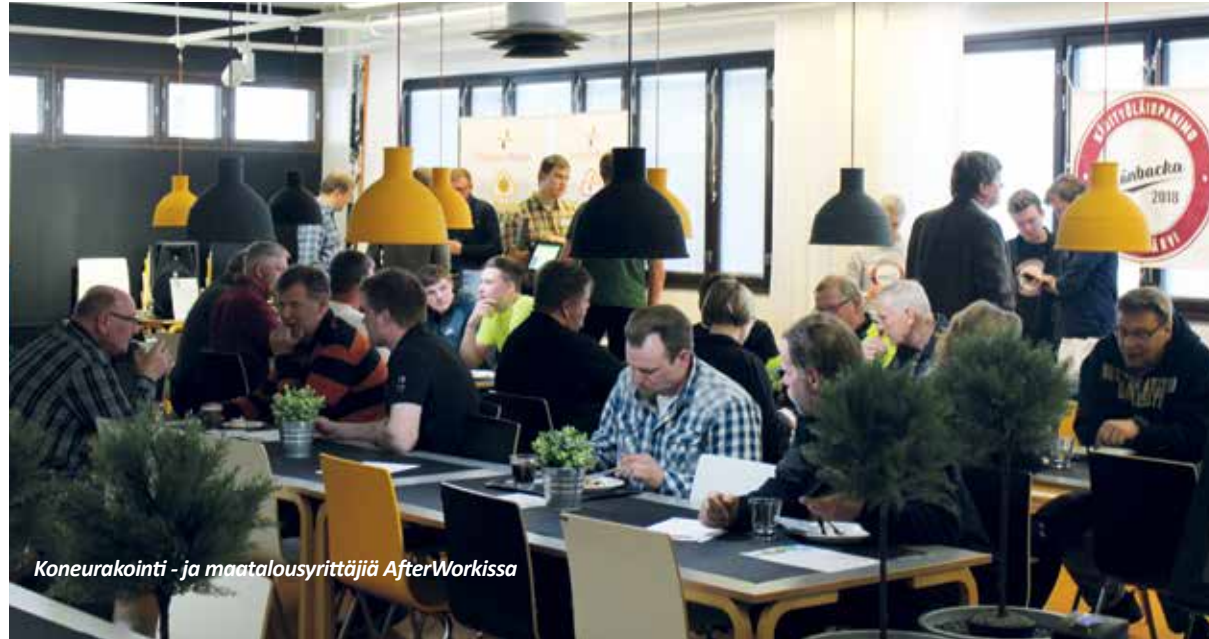
Koneurakointi - ja maatalousyrittäjiä AfterWorkissa

Työteho-seura järjesti 4.4. Rajamäellä koneurakointi- ja maatalousyrittäjille suunnatun tietotuokion uudella laisella "After work"- konseptilla. Ammattiasian lisäksi ohjelmassa oli jutustelua tuttuja kanssa, tarjoiluja, haastatteluja ja yritysesittelyjä. Osallistujia oli kaikkiaan paikalla noin 60. Yhteistyössä mukana olivat Koneyrittäjien liitto, Hankkija, Suonentieto, SKED sekä vastikään Nurmi-järvellä toiminnan aloittanut Grönbacka Panimo.