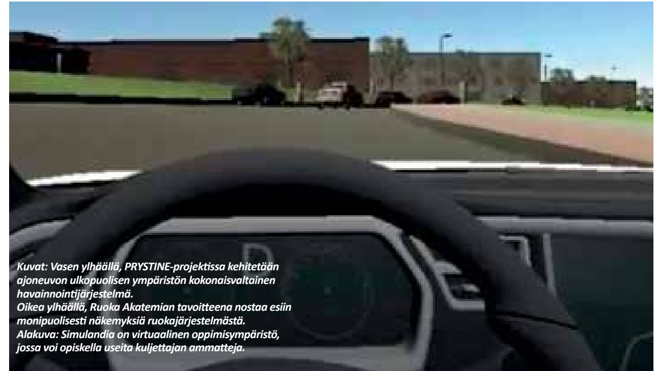
Kuvat: Vasen ylhäällä, PRYSTINE-projektissa kehitetään ajoneuvon ulkopuolisen ympäristön kokonaisvaltainen havainnointijärjestelmä. Oikea ylhäällä, Ruoka Akatemian tavoitteena nostaa esiin monipuolisesti näkemyksiä ruokajärjestelmästä. Alakuva: Simulandia on virtuaalinen oppimisympäristö, jossa voi opiskella useita kuljettajan ammatteja.