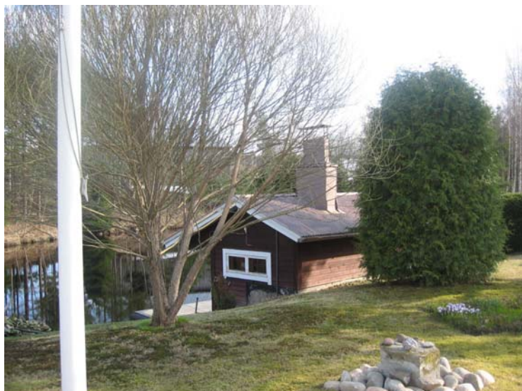
Kuva 6. Sauna on usein omalla pihalla.

Haastattelukohteiden asunnot olivat kaikki omakotitaloja. Talot jakautuivat melko tasaisesti yksi- ja kaksikerroksisiin taloihin. Haastattelukohteiden taloista yksikerroksisia oli yhdeksän ja kaksikerroksisia kahdeksan. Talot olivat harjakattoisia, puu- tai tiiliverhoiltuja. Kaikissa asunnoissa oli tulisija. Jokaisessa talossa oli myös pihamaa sekä useassa kohteessa myös puutarha. Talojen pihapiirissä oli yleisesti myös ulkorakennuksia ja monissa myös pihasauna.