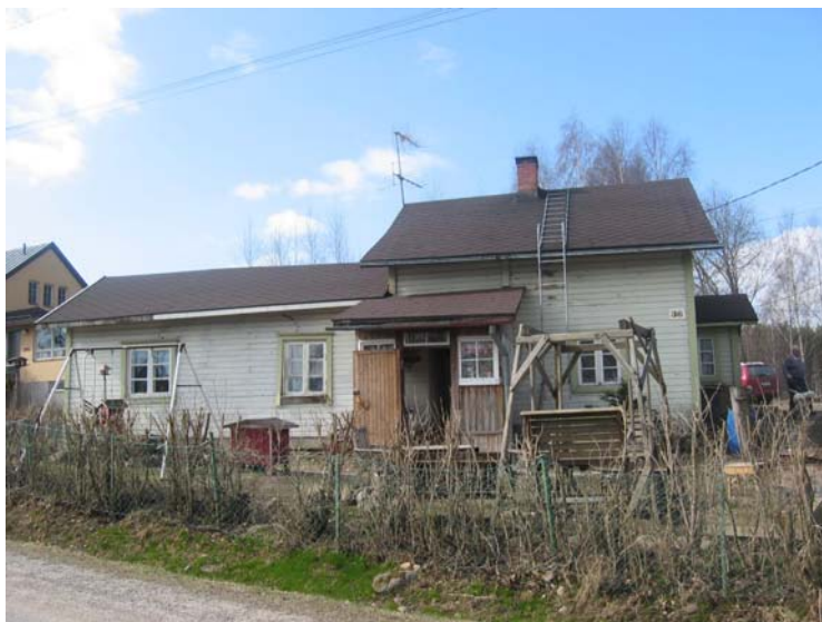
Kuva 3. Maaseudun talosta voi puuttua vesi- ja viemäriiitettä.

Haastattelukohteiden asuntojen ikä vaihteli paljon. Talojen rakennusvuodet olivat vuodesta 1910 vuoteen 1995. Tämä tarkoittaa sitä, että osa taloista oli vanhoja ja ne kaipasivat peruskorjausta. Esimerkiksi asunnosta saattoi puuttua vesi- tai viemäriiitettä. Osassa taloista ulkopinnoite oli rapistunut. Osa taloista oli aika uusia, ja ne olivat hyvässä kunnossa. Myös osa vanhoista taloista oli hyvässä kunnossa, koska ne oli remontoitu.