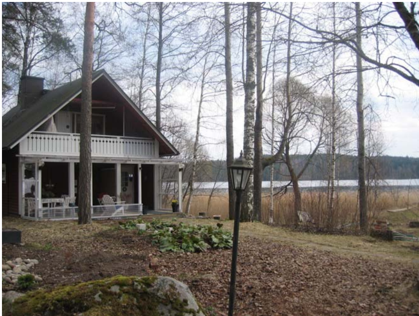
Kuva 1. Kesämökille palataan eläkeikäisenä.

Padasjoella ”liikkuvia tai paluumuuttajia” oli toinen puoli haastatelluista. He olivat muuttaneet pois Padasjoelta opiskelun ja työn vuoksi ja palaneet takaisin eläkeikäisenä, joko vanhaan lapsuudenkotiinsa tai kesämökille. Haastatelluissa oli myös asukkaita, jotka eivät viihtyneet kaupungissa eivätkä halunneet viettää siellä eläkepäiviään, vaan olivat päätyneet talon ostamiseen maaseudulta esimerkiksi kesämökkipaikkakunnaltaan. Syynä muuttoon oli muun muassa tekemisen puute kaupungissa ja maaseudun rauha. Töysässä kaikki haastatellut olivat asuneet samassa talossa, samalla paikkakunnalla tai lähiseudun naapurikunnissa koko elämänsä.