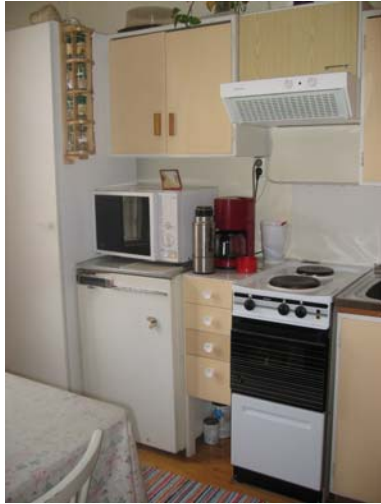
Kuva 11. Kaikilla oli jääkaappi ja liesi.