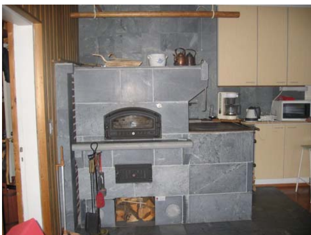
Kuva 13. Suurimmalla osalla oli joko leivinuuni tai takka.