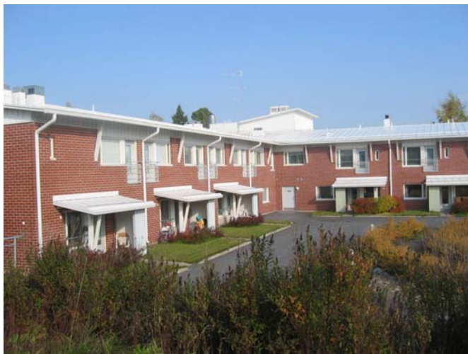
Kuva 17. Elviira on yksi vanhusten asunnoista Töysässä.

Töysässä ilmestyy kuukausittain Kuntatiedote, josta asukkaat saavat tietoa muun muassa kunnan tarjoamista palveluista ja erilaisista tapahtumista.