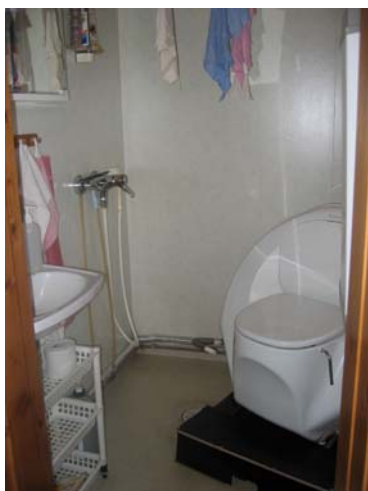
Kuva 7. Kompostivessa ei toiminut aina hyvin.

Maaseudulla kaikki talot eivät kuulu kunnallistekniikan piiriin. Yhdessä haastattelukohteessa ei ollut vesiliitäntää. Toisesta taloudesta puuttui viemäri-liitäntä. Haastatteluissa tuli myös esille ongelmia, jotka liittyivät kaivojen kuivumiseen ja talviaikaan jäätyviin vesijohtoihin. Huolestuneisuutta aiheutti myös tuleva EU-määräys, joka koskee maaseudun jätevesijärjestelmää. Esille nousi etenkin siitä aiheutuvat kustannukset.