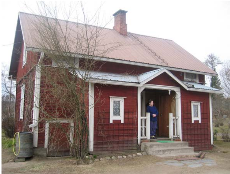
Kuva 2. Monet asuvat samassa talossa koko ikänsä.

Maaseudulla monet asuvat pitkään samassa asunnossa, usein melkein koko elämänsä. Haastatellut henkilöt olivat asuneet nykyisissä asunnoissaan kolmesta vuodesta 65 vuoteen, Padasjoella keskimäärin 33 vuotta ja Töysässä keskimäärin 28 vuotta. Haastattelukohteet eivät sijainneet aivan kunnan keskustaajamassa, vaan haja-asutusalueella eri puolilla kuntaa noin 2–30 km etäisyydellä keskustasta.