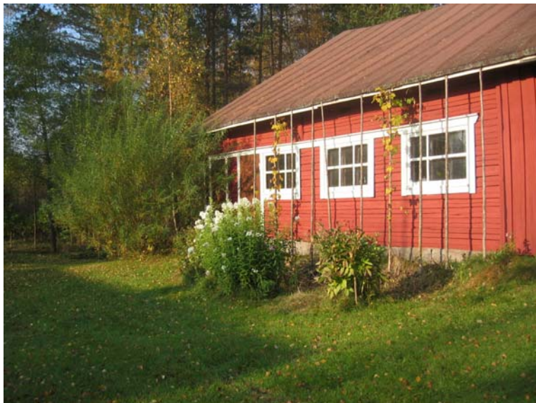
Kuva 5. Pihapiirissä on runsaasti varastotilaa.

Haastateltujen asuinkiinteistöt Padasjoella olivat keskimäärin 54 vuotta ja Töysässä noin 30 vuotta. Asuntojen pinta-alat olivat 50 \text{ m}^2 – 200 \text{ m}^2 . Keskipinta-ala asunnoissa oli Padasjoen haastattelukohteissa noin 122 \text{ m}^2 ja Töysän haastattelukohteissa noin 75 \text{ m}^2 . Huoneiden lukumäärä asunnoissa oli 2 h + keittiö – 7 h + keittiö. Padasjoella asunnoissa olevien huoneiden lukumäärä oli suurempi kuin Töysässä.