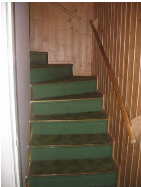
Kuva 14. Sisäportaavat ovat usein jyrkät.