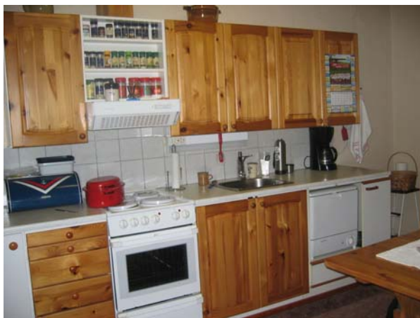
Kuva 10. Osalla keittiöt olivat hyvin varusteltuja ja asukkaiden mielestä ne toimivat hyvin.

”Minä laitan ruokaa ja passaan pöytään asti.”