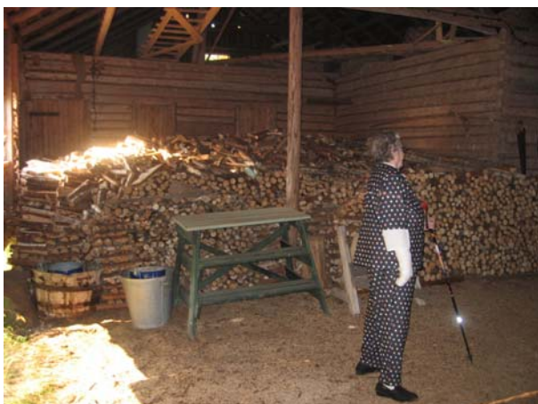
Kuva 12. Polttopuut tehdään usein itse ja varastoidaan piharakennuksessa.

”Sähkölämmitys on mahdollinen, mutta sitä ei ole käytetty. Lämmitetään puilla ja puut tehdään itse omasta metsästä.”