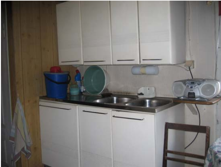
Kuva 8. Kaikilla ei ollut vesiliitäntää keittiössä.