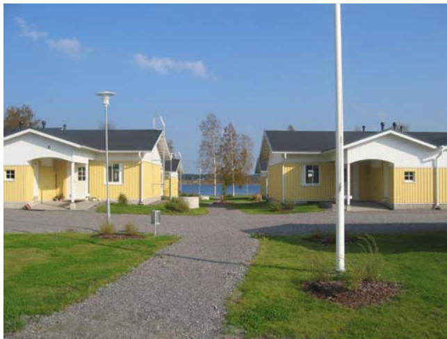
Kuva 16. Töysä on panostanut myös paluumuuttajiin rakentamalla heille asuntoja.

Töysän asukkaista vajaa 20 prosenttia on yli 65-vuotiaita ja väestön ikärakenne ei tule muuttumaan lähivuosina. Vasta vuosina 2010–2015 alkaa tapahtua muutos väestön vanhenemisen suuntaan. Töysään on muuttanut senioriasukkaita, joista osa on entisiä töysäläisiä eli paluumuuttajia. Ponnejärven rannalle on rakennettu senioririvitaloja, joista oli haastatteluhetkellä viisi huoneistoa myymättä. Rivitalojen yhteyteen on rakennettu myös yhteistiloja. Senioritaloihin on saatavilla kaikki palvelut, esimerkiksi pyykkipalvelut, siivouspalvelut ja ruokapalvelu. Kunnan suhtautuminen senioripaluumuuttajiin on kahtalainen: Toisaalta uusia asukkaita kuntaan ei saisi haalia, koska se voi aiheuttaa lisämenoja sosiaalipuolelle. Toisaalta on hyvä, että saadaan uusia, varakkaitakin asukkaita kuntaan. Monet paluumuuttajat ovat myyneet esimerkiksi pientalon pääkaupunkiseudulla ja rakentaneet uuden Töysään. Useat myös peruskorjaavat vanhan kotipaikkansa omaan käyttöönsä.