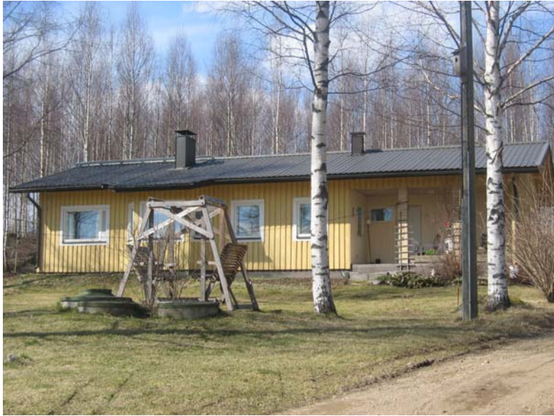
Kuva 4. Maaseudulla asutaan usein väljästi ja lähellä lapsia.

Haastateltujen asuinkiinteistöt Padasjoella olivat keskimäärin 54 vuotta ja Töysässä noin 30 vuotta. Asuntojen pinta-alat olivat 50 \text{ m}^2 – 200 \text{ m}^2 . Keskipinta-ala asunnoissa oli Padasjoen haastattelukohteissa noin 122 \text{ m}^2 ja Töysän haastattelukohteissa noin 75 \text{ m}^2 . Huoneiden lukumäärä asunnoissa oli 2 h + keittiö – 7 h + keittiö. Padasjoella asunnoissa olevien huoneiden lukumäärä oli suurempi kuin Töysässä.