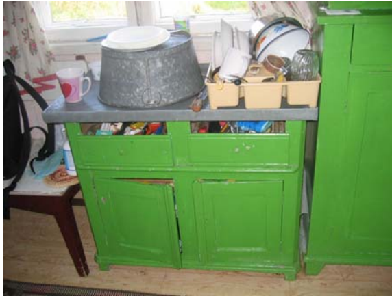
Kuva 9. Kaikilla ei ollut astianpesukonetta.

Maaseudulla viljellään vihanneksia ja juureksia sekä poimitaan marjoja ja sieniä, joten kylmäsäilytystä tarvitaan paljon. Joissain keittiöissä oli tämän vuoksi maakellari, jonne oli kulku keittiön lattiassa olevasta luukusta. Tosin tutkimuksessa ei tarkemmin selvitetty kaikkien talouksien osalta maakellarin olemassaoloa ja sen käytettävyyttä.