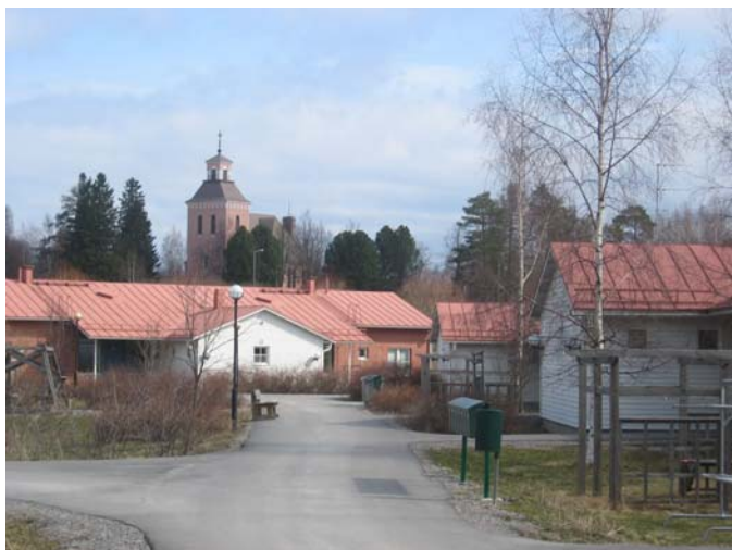
Kuva 18. Vanhusten asuntoja Padasjoen keskustassa.

Padasjoella on vahvistettu vuonna 2002 Padasjoki 2012 -strategia. Perusturvalautakunta ja perusturvatoimialan johtoryhmä ovat laatineet ja hyväksyneet keväällä 2003 perusturvan strategian vuoteen 2008. Lisäksi kunnassa toimii vanhusneuvosto, jonka tehtävänä on edistää vanhusten, viranomaisten ja järjestöjen yhteistoimintaa ja edesauttaa ikääntyviä osallistumaan ja vaikuttamaan kunnallisessa päätöksenteossa.